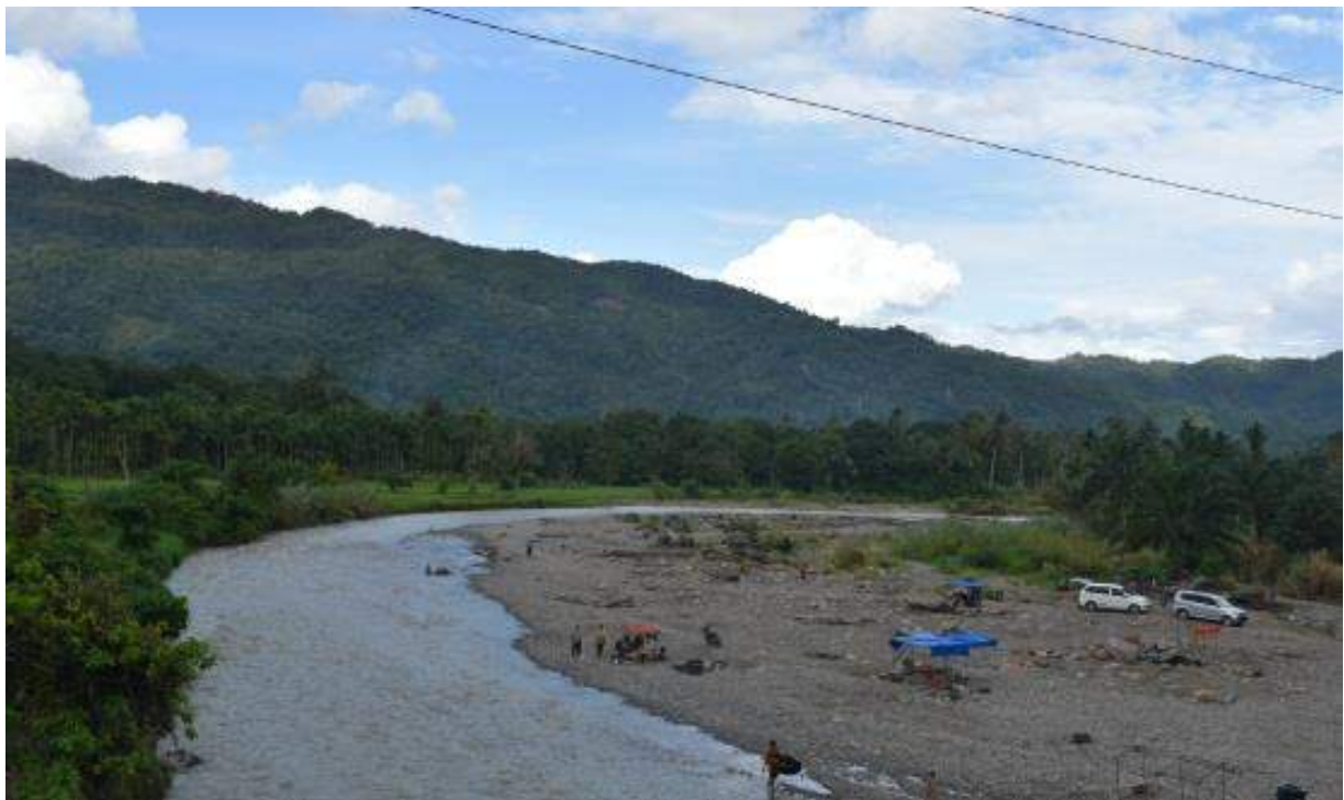
Gambar 3. Aktivitas penambangan emas secara tradisional di Hulu sungai Barumum, Padang Lawas (Dokumentasi. BPCB 2017)

dapat menopang kemakmuran negerinya. Kekayaan Panai dari sumberdaya alam telah terbukti memberi banyak kekayaan material kerajaan Sriwijaya pada masa lampau. Kondisi ini sangat menguntungkan secara ekonomis bagi Colamandala maupun Majapahit.